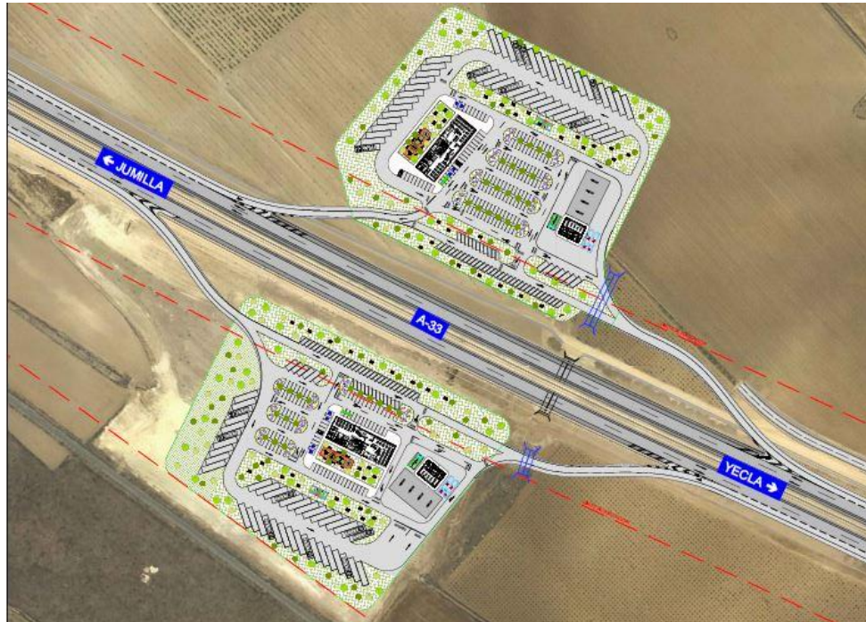
Diseño de anteproyecto del Área de Servicio del Altiplano

Esta autovía se convertirá en la alternativa más rápida y de mayor ahorro de combustible entre Valencia y Murcia, especialmente para vehículos pesados, al contar un excelente trazado y una pendiente optimizada.