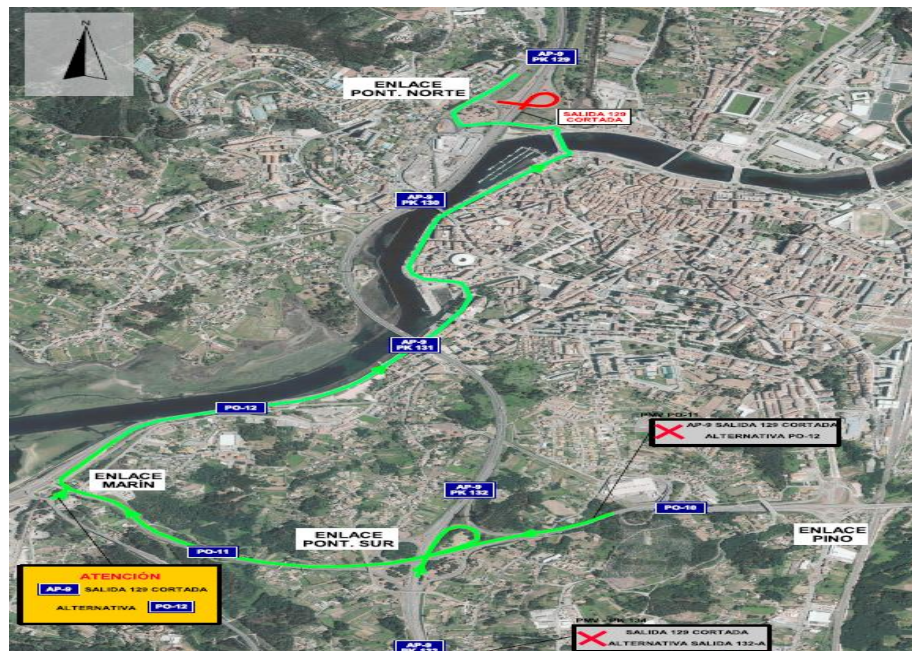
Itinerario alternativo debidamente señalado para el movimiento Vigo-Pontevedra

Se tomará la salida anterior (132-A (Pontevedra Sur)) y se discurrirá posteriormente tal y como se muestra en la figura a continuación: