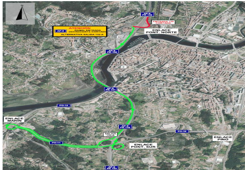
Itinerario alternativo debidamente señalado para el movimiento Pontevedra-Santiago de Compostela