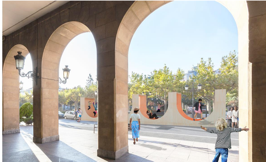
Prismarium, de Ignacio Hornillos y Javier F. Contreras: