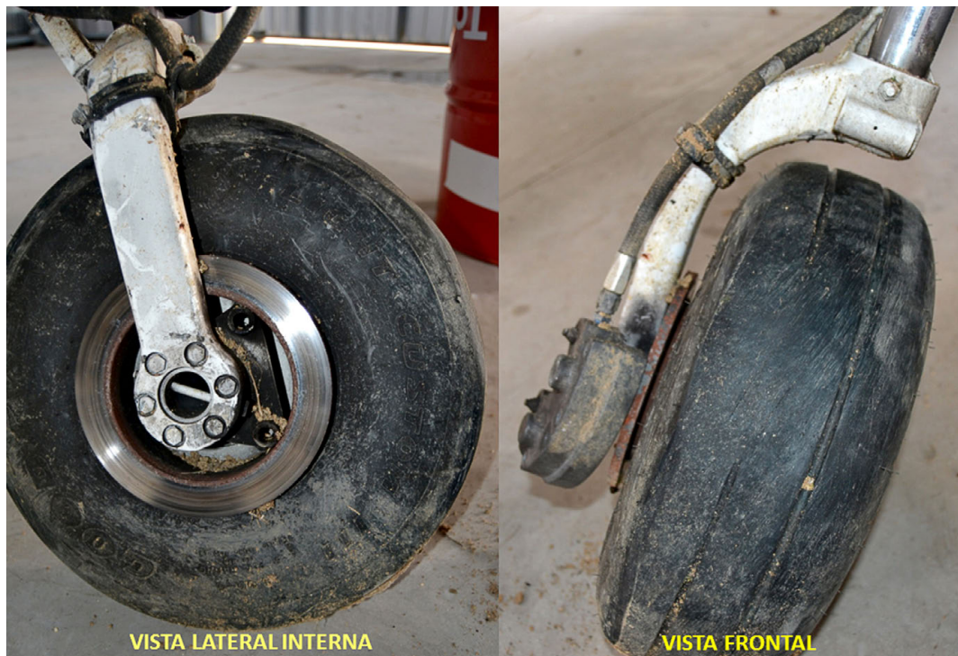
Figura 2. Huellas de desgaste en la cubierta izquierda

El neumático de la rueda derecha no mostraba signos anormales en su superficie.