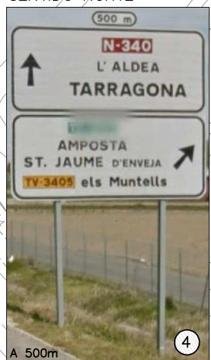
FUERA DE PLANO SENTIDO NORTE