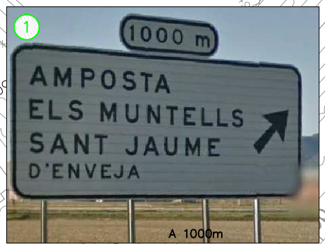
FUERA DE PLANO SENTIDO SUR