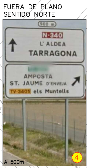
FUERA DE PLANO SENTIDO NORTE