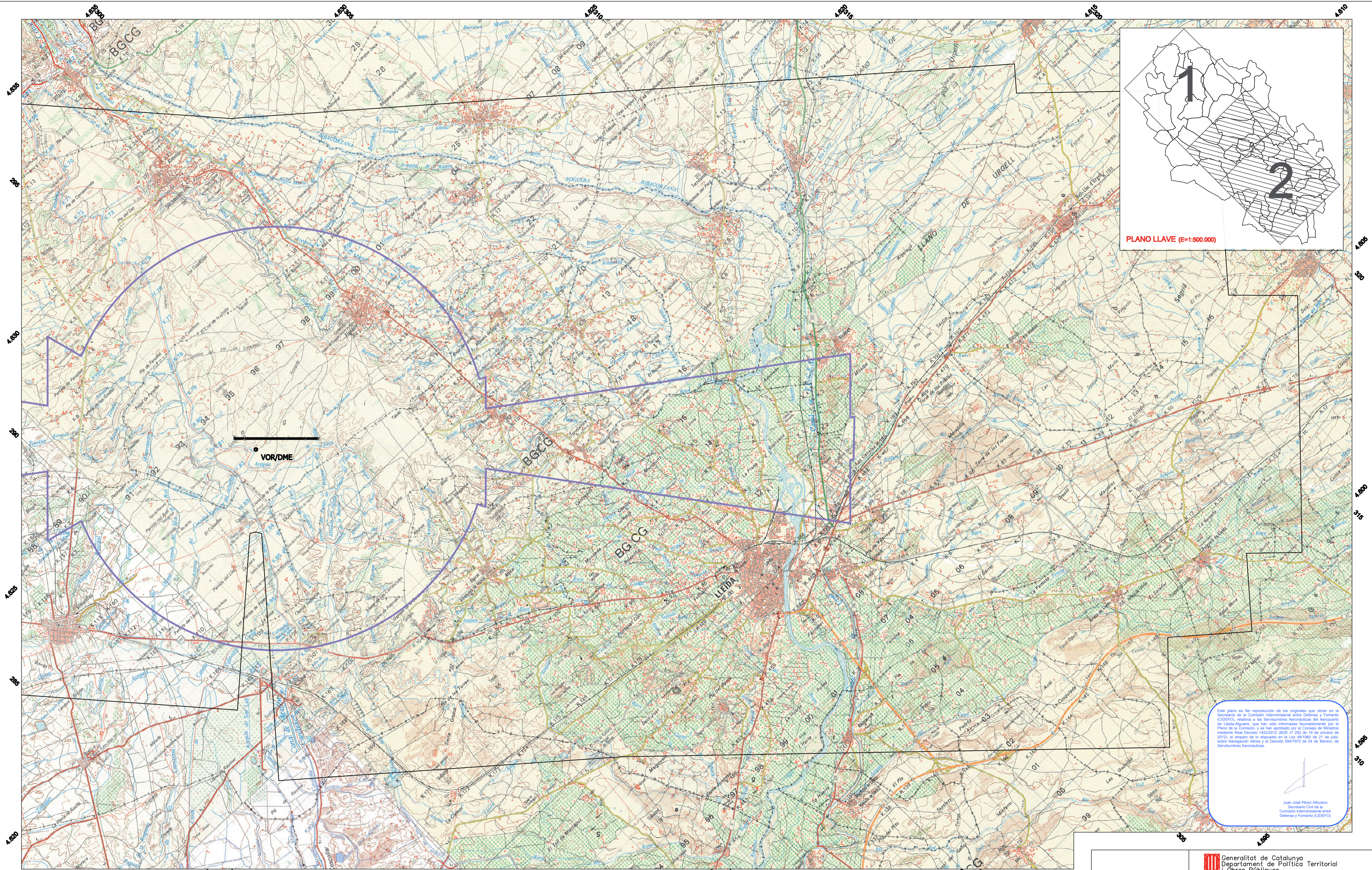
PLANO LLAVE (E=1:500.000)

Este plano es fiel reproducción de los originales que obran en la Secretaría de la Comisión Interministerial entre Defensa y Fomento (CIDEFO), relativos a las Servidumbres Aeronáuticas del Aeropuerto de Lleida-Alguaire, que han sido informados favorablemente por el Pleno de la Comisión, y se han aprobado por el Consejo de Ministros mediante Real Decreto 1422/2012 (BOE nº 252 de 19 de octubre de 2012), al amparo de lo dispuesto en la Ley 48/1990 de 21 de julio, sobre Navegación Aérea y el Decreto 584/1972 de 24 de febrero, de Servidumbres Aeronáuticas.