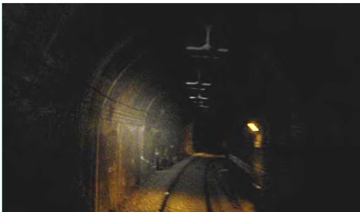
Vista del interior del túnel hacia el apeadero de El Clot-Aragó.