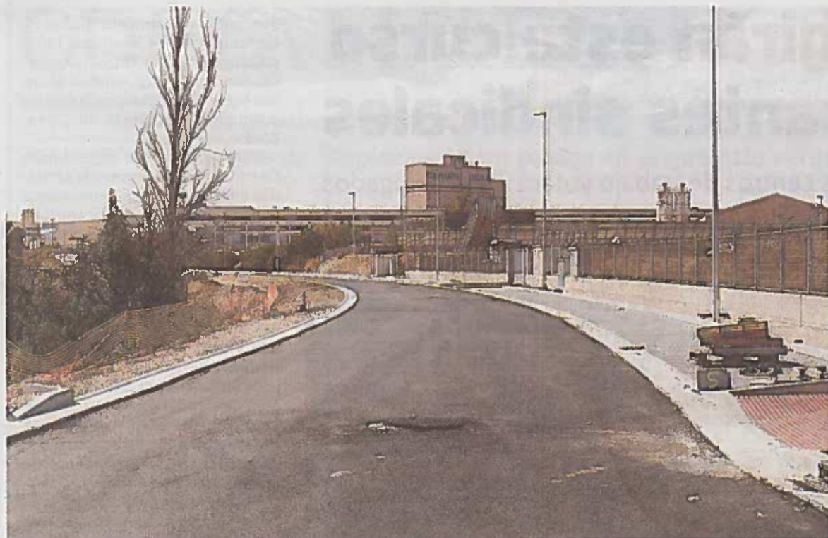
En la nueva carretera, ya casi terminada, aún falta que se extienda la capa de rodadura.