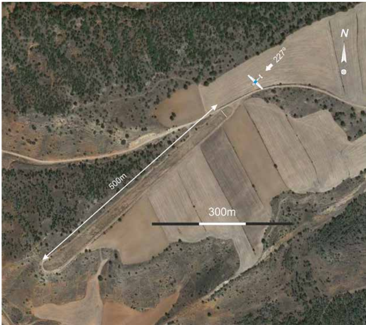
Fig. 2: Imagen aérea de la finca y posición y derrota de la aeronave en su aproximación final