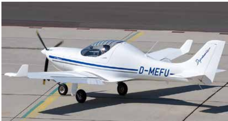
Fig. 5: Aeronave D-MEFU

En la foto se pueden apreciar los winglets en la punta de plano, que coinciden con la siniestrada.