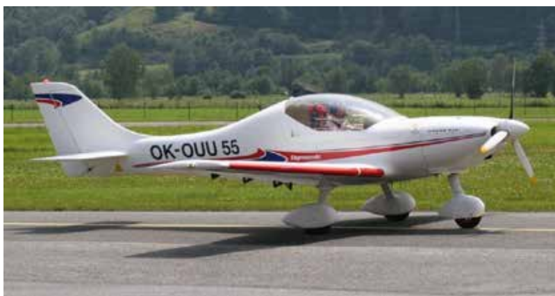
Fig. 4: Aeronave OK-OUU 55

Por parte de la Policía alemana se verificó que esta aeronave se encontraba en el aeródromo de Reidelbach (Alemania), comprobándose asimismo que esta aeronave difería respecto de la encontrada en Valdecebro en el color y en la forma de las alas (en concreto la aeronave siniestrada montaba winglets en punta de ala y la de Alemania no).