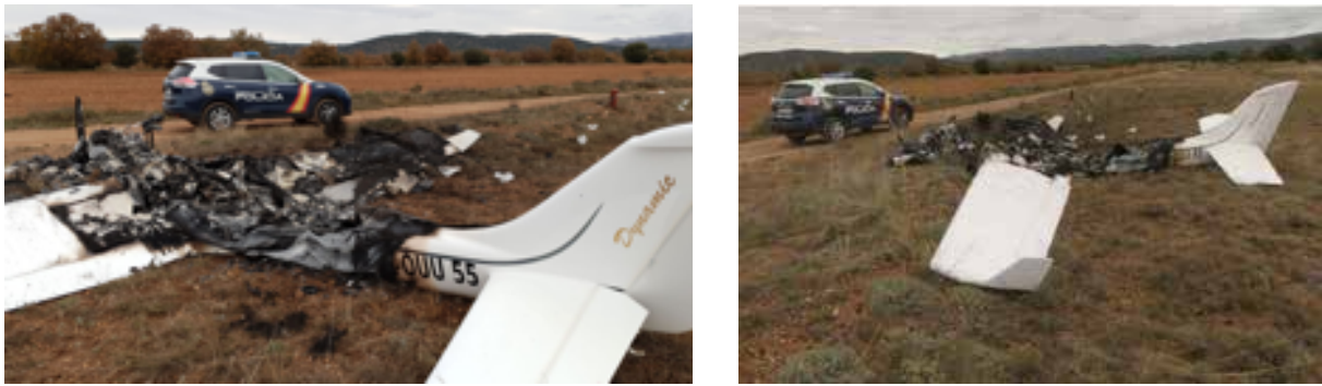
Fig. 1: Vistas de la aeronave tras el accidente

Se procedió a inspeccionar los restos de la aeronave, así como las inmediaciones de la zona, para localizar indicios que pudieran conducir a la presencia de víctimas o posibles heridos. El resultado fue negativo, no hallándose vestigio biológico alguno de los posibles ocupantes. Asimismo, tampoco se hallaron efectos personales.