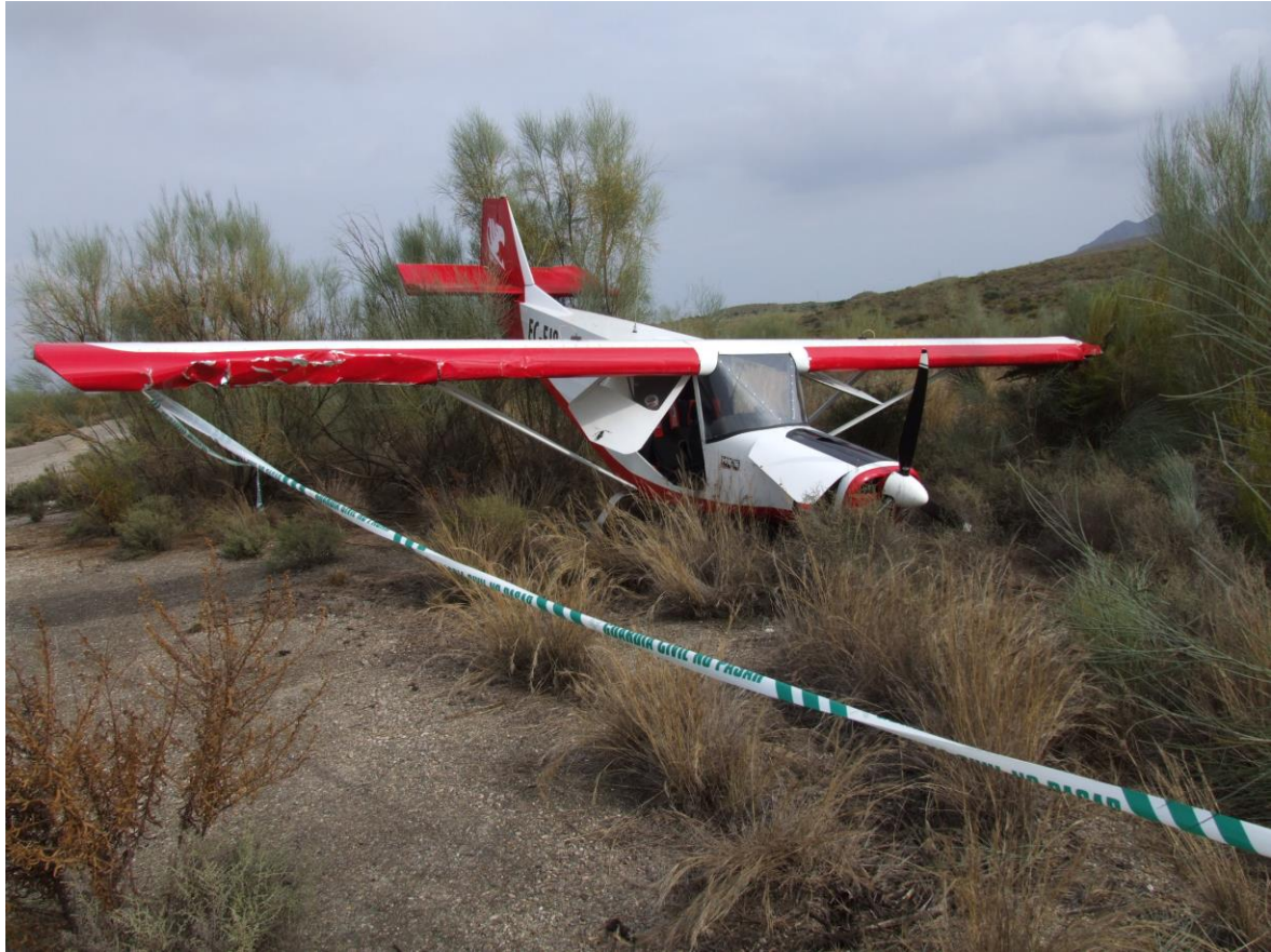
Fig. nº 3 Vista frontal del estado de la aeronave