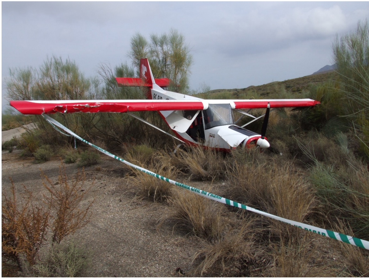
Fig. n° 3 Vista frontal del estado de la aeronave