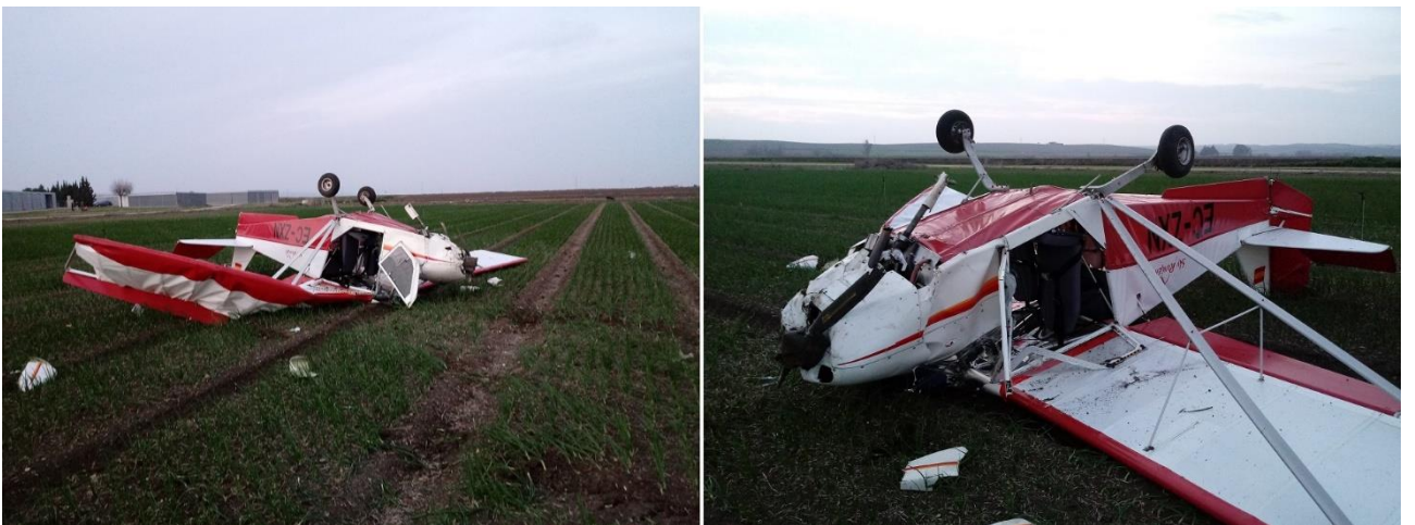
Figura 3. Daños en aeronave EC-ZXN

En la Figura 3 puede verse el estado de la aeronave tras el accidente.