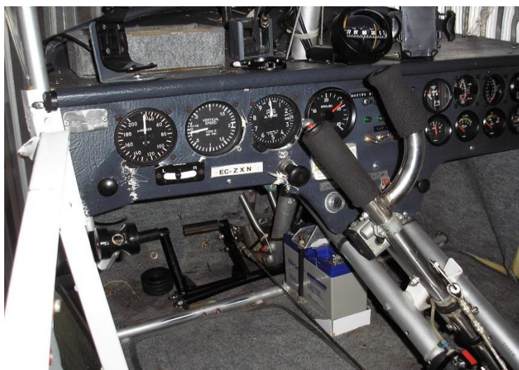
Figura 1. Panel aeronave EC-ZXN

En la Figura 1 se incluye una imagen del panel de instrumentos de cabina.