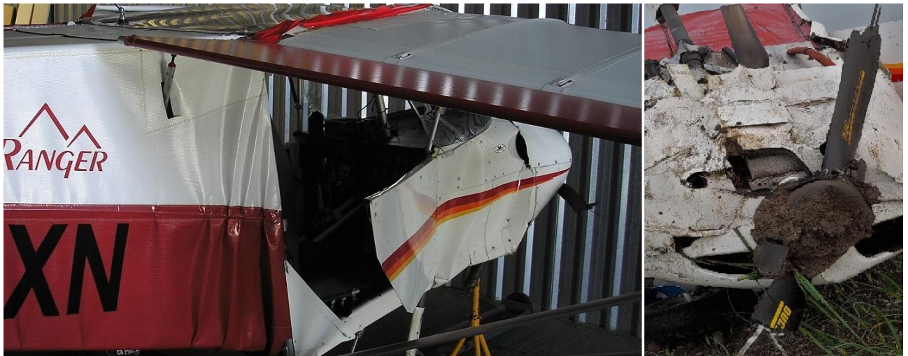
Figura 4. Aeronave EC-ZXN

Se observó que se habían producido daños importantes durante el vuelco que afectaban principalmente al fuselaje, hélice y tren, como se refleja en la Figura 4.