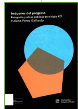
Autora: Helena Pérez Gallardo Editor: Ediciones Complutense

La obra empieza con un análisis del origen de la aparición de la cámara fotográfica en los proyectos más importantes del siglo XIX y cómo en las principales instituciones educativas y representativas de la profesión, la fotografía se convirtió pronto en una aliada documental. Sigue en su desarrollo con una descripción de los instrumentos, técnicas y procedimientos fotográficos y de los primeros ingenieros que la utilizaron. A continuación, se hace un recorrido por los estudios fotográficos y fotógrafos de obras públicas más importantes del momento en el contexto europeo primero y después en España. Termina esta publicación con un interesante análisis comparativo entre ingeniería y fotografía, así como su utilización en las revistas ilustradas y como objetos de exposición. El recorrido sigue un criterio cronológico y el contenido gráfico es, en muchos casos, novedoso. Se completa con abundante bibliografía y un índice onomástico.