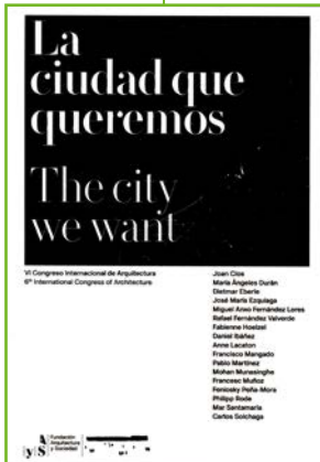
Autor: VVAA Editor: Fundación Arquitectura y Sociedad