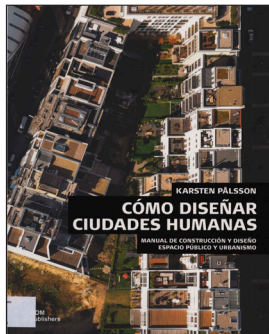
Autor: Karsten Palsson. Editorial: DOM publishers

Este manual de construcción y diseño, espacio público y urbanismo, trata sobre la renovación de las ciudades con un enfoque que garantice el espacio para las personas con una nueva perspectiva de la arquitectura a escala humana. La ciudad en su conjunto en un marco que garantice la vida urbana de calidad.