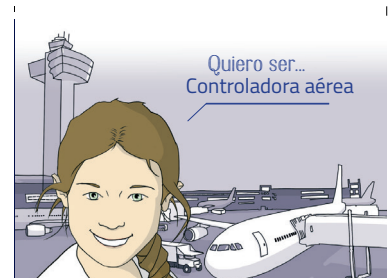
Edita: Aprocta y Fundación ENAIRE