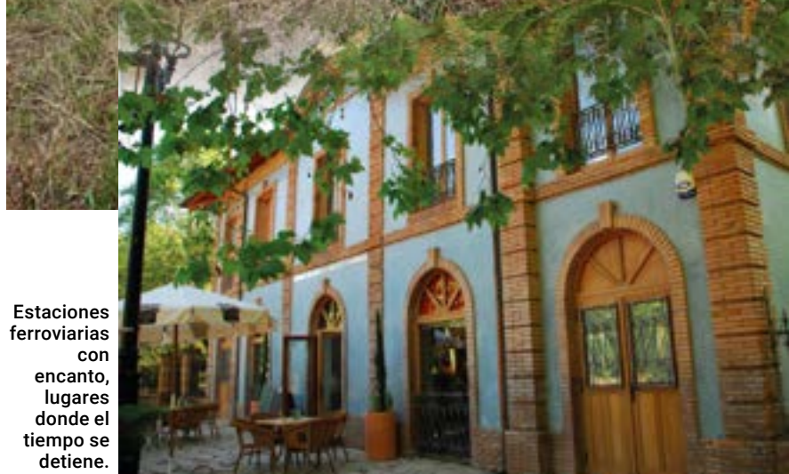
Estaciones ferroviarias con encanto, lugares donde el tiempo se detiene.