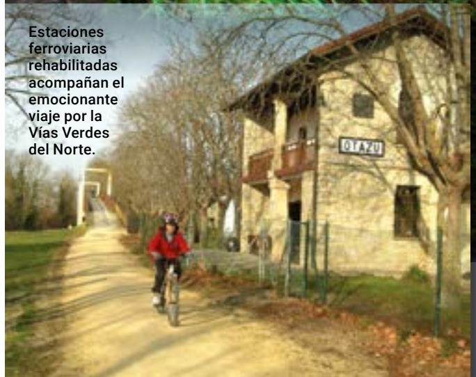
Estaciones ferroviarias rehabilitadas acompañan el emocionante viaje por la Vías Verdes del Norte.

años han ido cubriendo de árboles y arbustos parte de las antiguas explotaciones mineras a cielo abierto, que dejan ver su rastro en los antiguos cargaderos que se levantan tozudos en medio del camino.