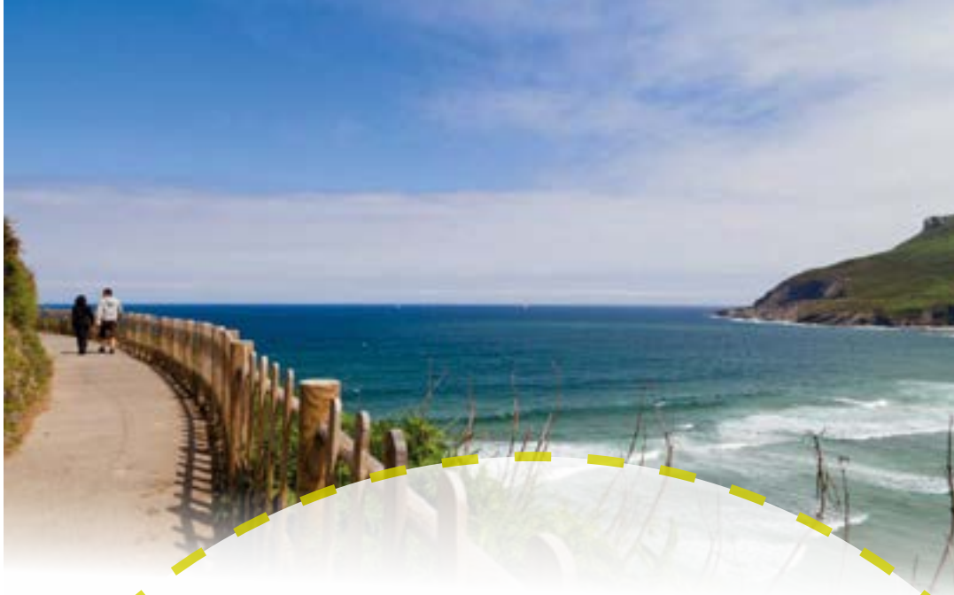
Vía Verde Paseo de Itsas lur, ruta espectacular colgada sobre los acantilados de la costa más occidental de Bizkaia.