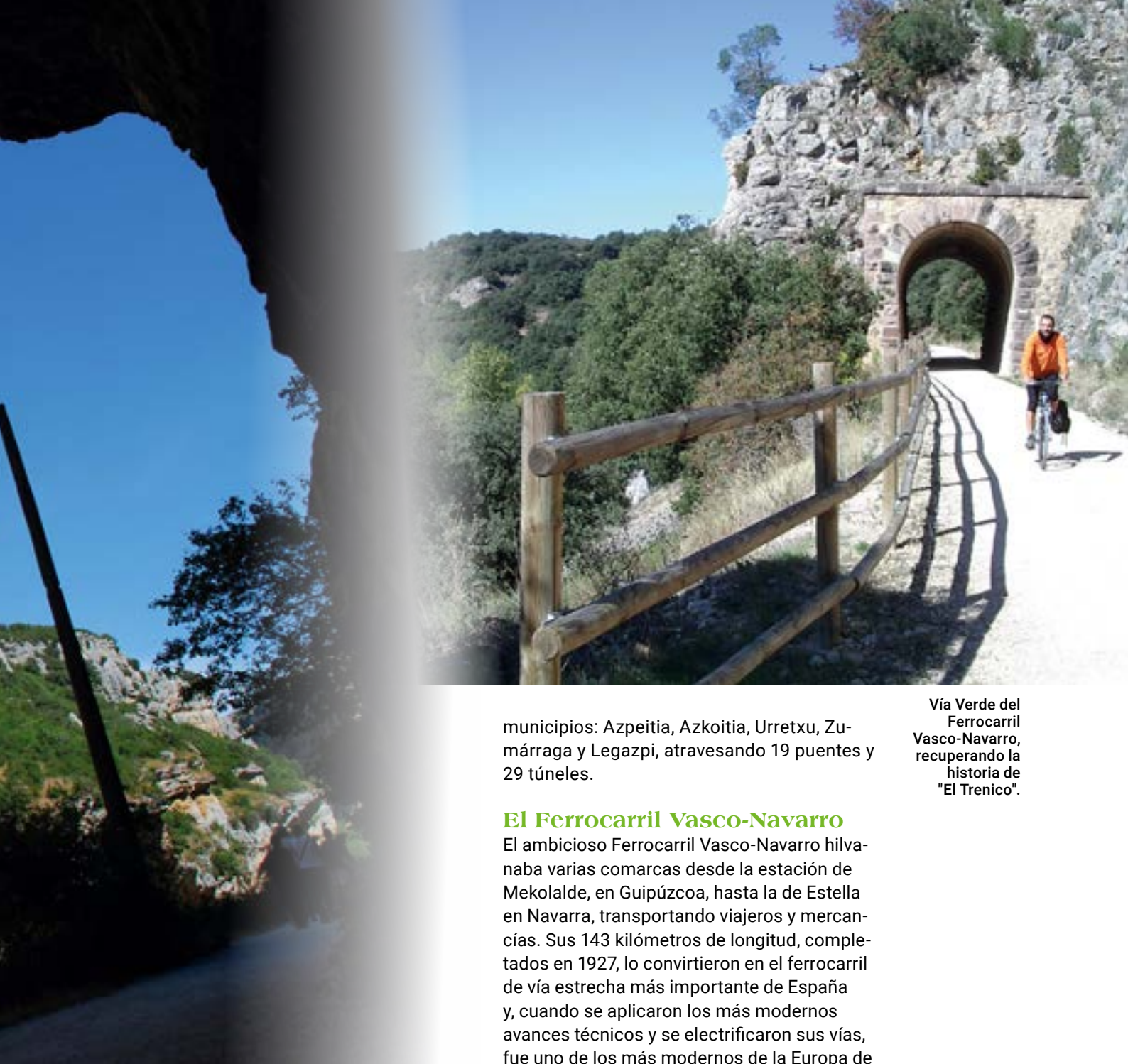
Vía Verde del Ferrocarril Vasco-Navarro, recuperando la historia de "El Trenico".

municipios: Azpeitia, Azkoitia, Urretxu, Zumárraga y Legazpi, atravesando 19 puentes y 29 túneles.