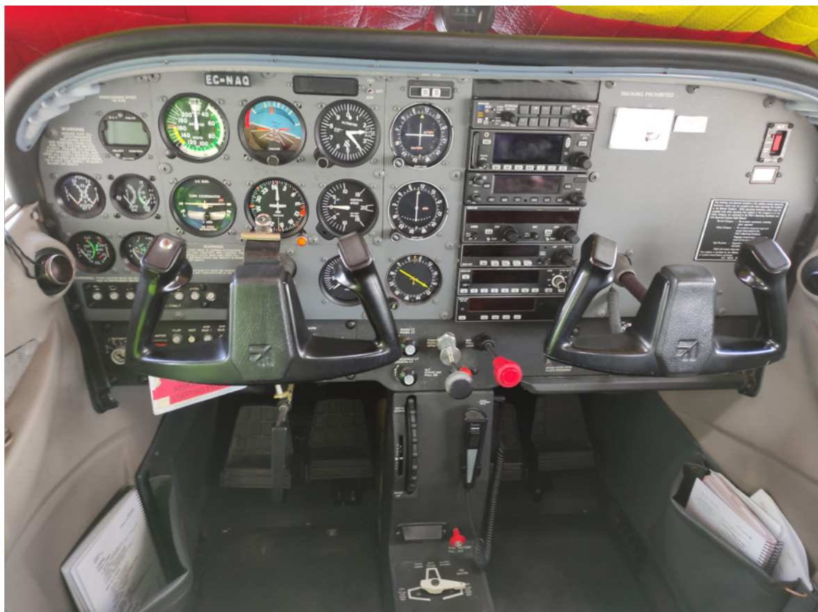
Fig.1: Cabina de la aeronave EC-NAQ. Ambas cabinas son similares.

En el momento del incidente la aeronave tenía 9000 horas y el motor 1300 horas.