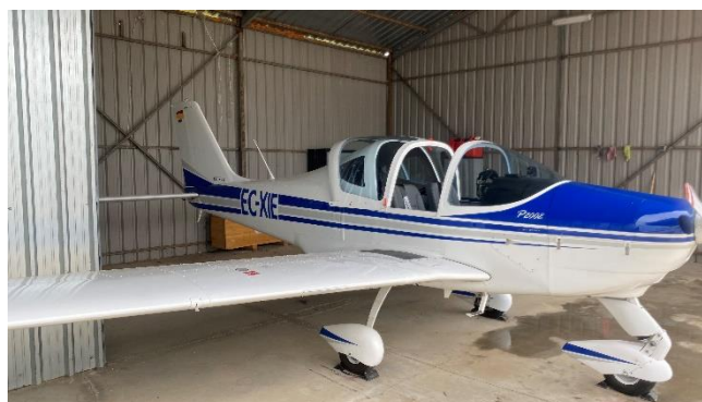
Figura 3. Imagen de la aeronave EC-XIE.

Al momento del suceso la célula contabilizaba 2014:30 FH.