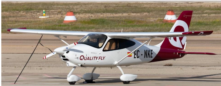
Figura 2. Imagen de la aeronave EC-NKE.