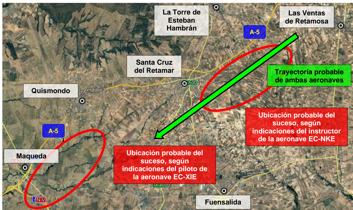
Figura 1. Ubicaciones probables de los eventos según las declaraciones de los pilotos de ambas aeronaves.

La aeronave prosiguió con su vuelo con normalidad, sin producirse daño alguno como consecuencia del suceso.