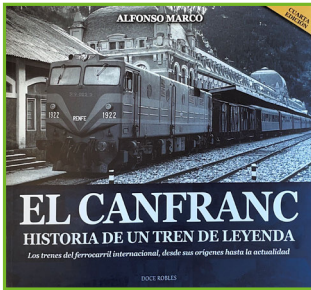
Autor: Alfonso Marco Edita: Editorial Doce Robles

Esta es una historia de trenes. Cuenta el pasado con nostalgia, y se refiere a la decadencia, la épica y esfuerzo, también alegría, desesperanza y cruda realidad. Es un libro cargado de sentimientos, pero sobre todo es una historia dedicada al Canfranc y sus trenes, a la estación y al conjunto de la línea Pau-Canfranc-Zaragoza.