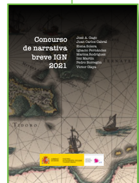
Edita: Centro Nacional de Información Geográfica (CENIG)