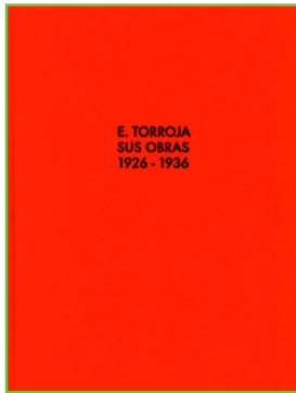
Edita: Cedex Autor: Eduardo Torroja Miret

La publicación Obras Principales de Hormigón Armado proyectadas y dirigidas por Eduardo Torroja de 1926 a 1936 por parte de CEHOPU, en colaboración con la Fundación Eduardo Torroja, constituye una iniciativa cuya finalidad persigue rendir un merecido homenaje al insigne ingeniero, vinculado durante su trayectoria al CEDEX. Se trata de una edición facsimilar de una obra inédita, pues si bien Torroja pretendió publicarla en 1936, el estallido de la Guerra Civil impidió que viera la luz.