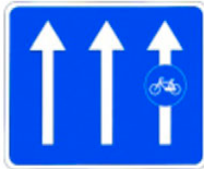
Ejemplos de señalización sobre circulación vial.