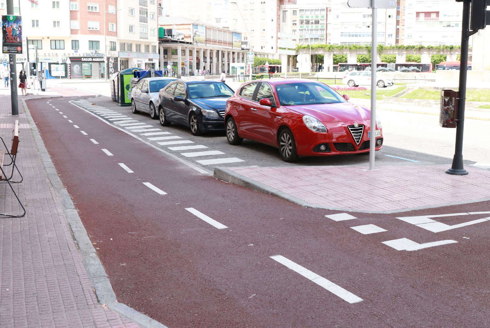
Diseño y asfaltado de intersección en carril bici segregado.

etc.). Es importante destacar que no se tratará de una norma de obligado cumplimiento, pues de acuerdo con el reparto competencial existente, el Mitma no puede imponer condiciones de este tipo a administraciones autonómicas o locales. No obstante, esta guía seguro que tendrá una gran acogida ya que supondrá una ayuda y orientación a la hora de llevar a cabo políticas de fomento de la movilidad ciclista o del cicloturismo mediante la dotación de infraestructura específica de calidad.