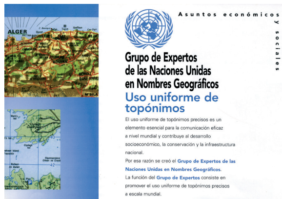
Nazio Batuetako informazio-foiletoa

Izen Geografikoen Normalizazioari buruzko Nazio Batuen Konferentziak (1967tik bost urtero antolatzen dira) herrialde bakoitzean izen geografikoen inguruko organo nazional bat egotea gomendatzen dute, gai horretan eskumena duten erakundeak koordinatzeko eta estatu mailan benetako normalizazioa lortzeko, nazioarteko normalizazioari ekin aurretik.