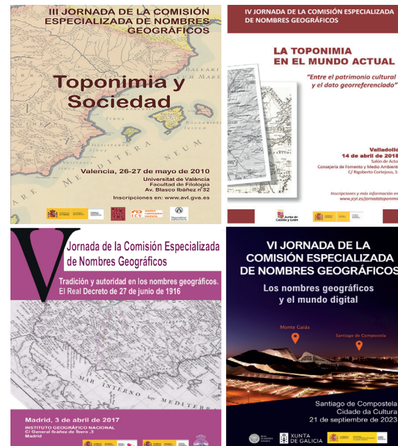
Izen Geografikoen Batzorde Espezializatuaren jardunaldiak.