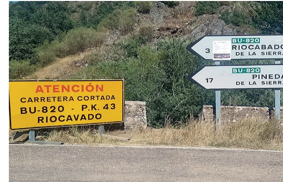
Bide-seinaleetan oker erabilitako toponimo baten adibidea. Izen ofiziala «Riocabado».

Izen normalizatuaren erabilera ezinbestekoa da toki bat zalantzarik gabe identifikatzeko. Horregatik, oso garrantzitsua da herri administrazioetan, hedabideetan, kartografian, informazio geografikoko sistemetan, bide-seinaleetan eta argitalpenetan erabiltzea.