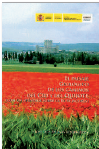
Salinas Rodríguez, José Luis: El paisaje geológico de los caminos del Cid y del Quijote (con un apéndice sobre la Ruta Jacobea) . Centro de Publicaciones, Ministerio de Fomento, 2017.