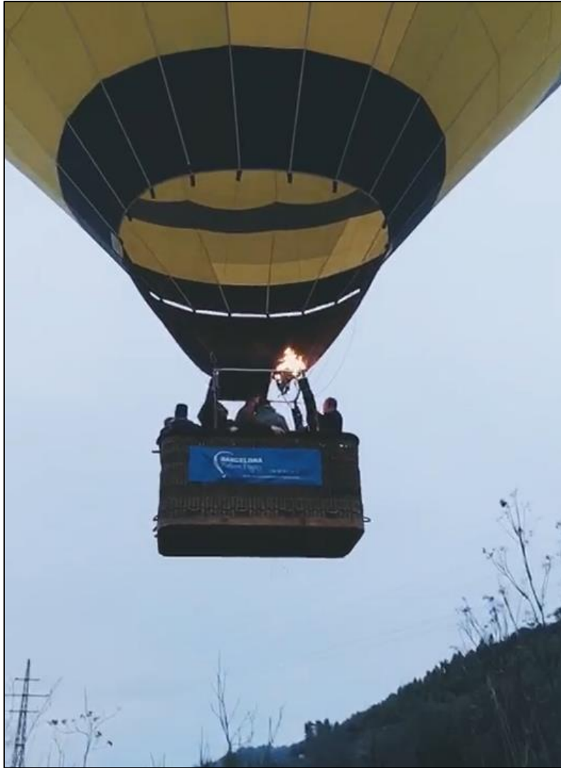
Ilustración 5: Captura de video donde se ve el despegue del globo

Desde ese momento el globo se desplazó siguiendo la cuenca del río Llobregat a baja altura (menos de 100 metros).