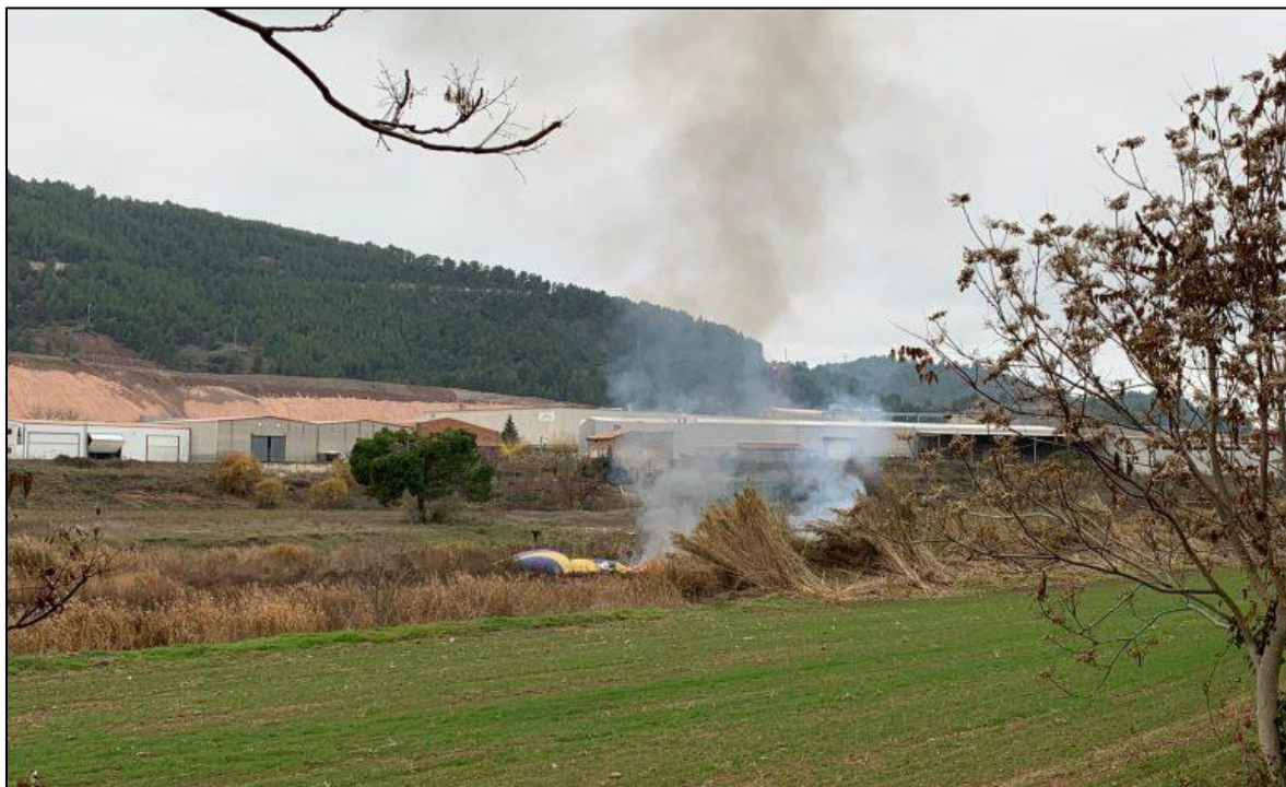
Ilustración 3: Lugar del accidente visto desde la carretera B-430

La zona era húmeda y la superficie del terreno llana. Las características del lugar fueron propicias para que los pasajeros pudieran bajar y alejarse fácilmente de la barquilla en llamas.