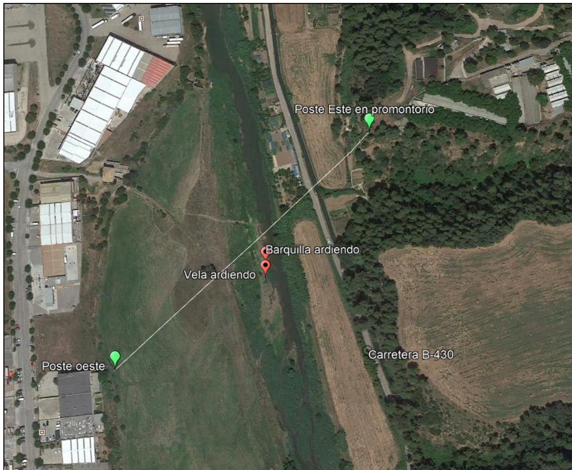
Ilustración 4: Vista cenital del lugar del accidente (extraído de Google Earth)

El globo hizo un primer contacto con el suelo, momento en el que saltaron dos pasajeros. Tras la pérdida de peso, el globo ascendió unos centímetros antes de volver a caer. Esta segunda vez ya se quedó inmóvil y el resto de los pasajeros y el piloto pudieron salir de la cesta.