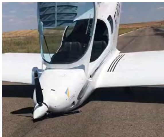
Figura 2: Vista general de la aeronave

La aeronave quedó en la pista tras colapsar la pata de morro como consecuencia de los rebotes. Entre otros, se detectaron daños en el tren principal izquierdo, la hélice y capo del motor.