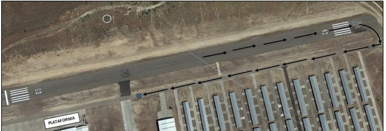
Figura 3. Trayectoria y punto de colisión

En la imagen de la Figura 3 se indica con flechas la trayectoria seguida por la aeronave desde el aterrizaje hasta el punto de colisión en la calle de rodaje.