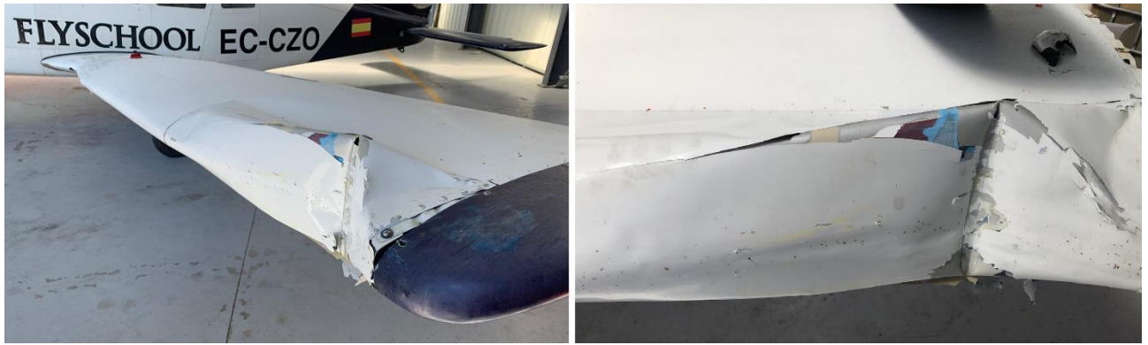
Figura 1. Daños en aeronave EC-CZO

Puede observarse como resultó dañado el borde de ataque del plano en aproximadamente un tercio de su longitud.