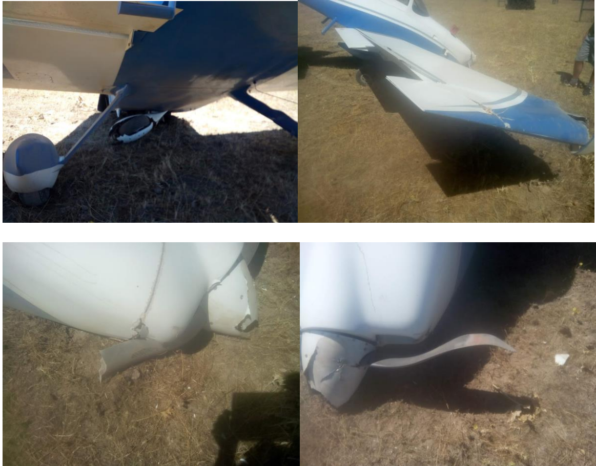
Fig. nº 3.- Detalle de daños de la aeronave

La aeronave, tras un primer contacto con la pista y posterior rebote, se fue al aire describiendo una trayectoria curva hacia la izquierda, de manera que, tras rebasar la valla perimetral del aeródromo, a una distancia de 12,7 m, contactó de nuevo con la rueda izquierda del tren de aterrizaje principal contra el terreno.