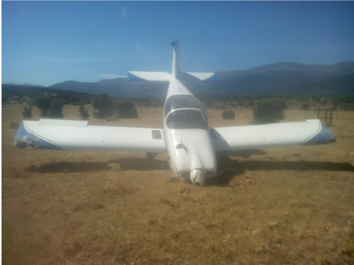
Fig. nº 2.- Estado final de la aeronave

El piloto resultó ileso y el pasajero herido leve. La aeronave resultó con daños importantes en fuselaje, planos, tren de aterrizaje, hélice y motor.