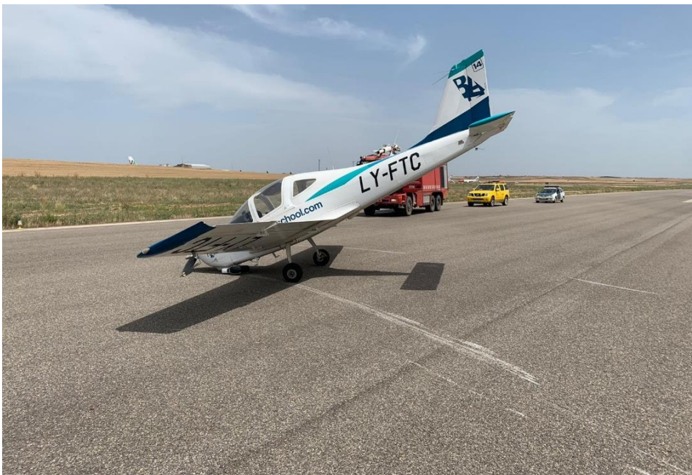
Fig. 1: Vista lateral de la aeronave tras el accidente

El alumno piloto resultó ileso y pudo abandonar la aeronave por sus propios medios. La aeronave sufrió daños importantes.