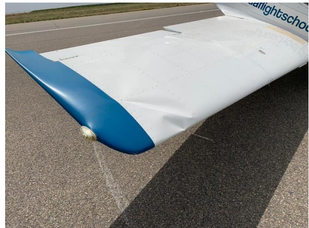
Figs. 2 y 3: Daños en parte delantera y en la punta del semiplano derecho de la aeronave