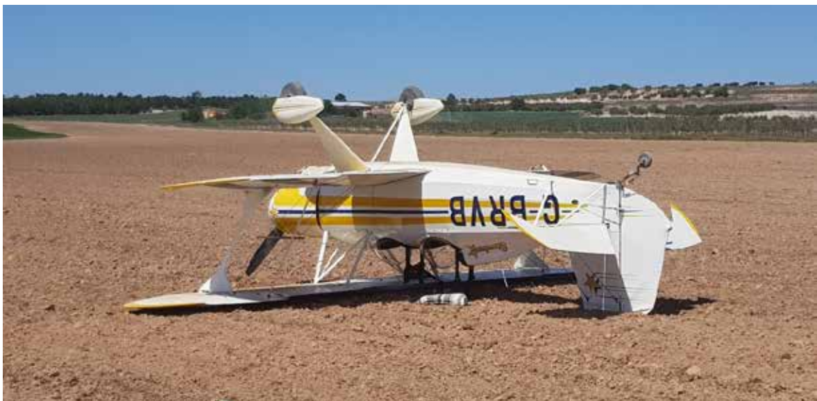
Figura 2. Fotografía de la aeronave tras la toma

Cuando la aeronave había recorrido unos 200 m y tenía ya poca velocidad, el piloto actuó suavemente sobre el freno para evitar caer en una zanja que había en el borde de la parcela.