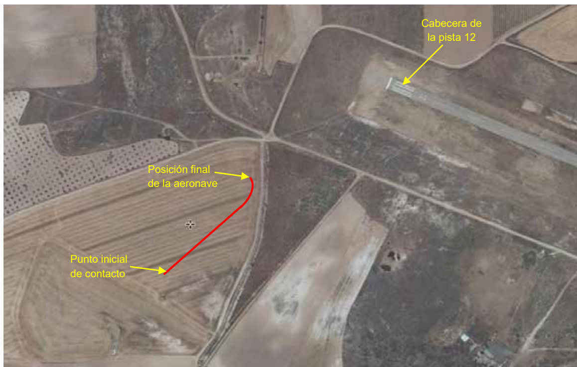
Figura 1. Fotografía aérea de la zona del accidente, en la que se ha marcado con un trazo rojo el recorrido en tierra realizado por la aeronave. La pista del aeródromo de Lillo puede verse en la parte superior derecha

Posteriormente se realizaron cuatro vuelos locales de unos 10 minutos de duración cada uno.