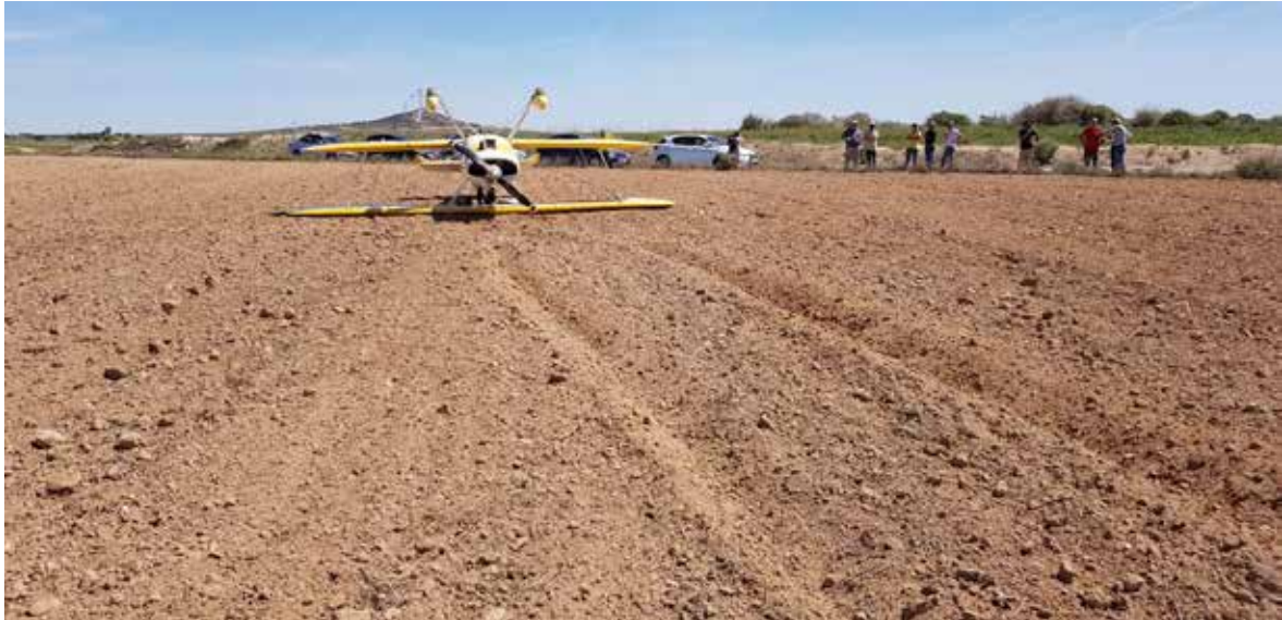
Figura 4. Fotografía de la aeronave y de la parte final de las huellas de rodaje

forma sensiblemente rectilínea en dirección Noreste durante 150 m. En este punto se desviaban hacia la izquierda y continuaban unos 40 m en rumbo Norte, hasta llegar al lugar en el que se encontraba la aeronave.