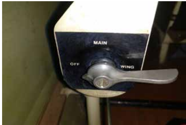
Figura 5. Fotografía de la llave selectora de combustible (en la posición cerrada)

Pensaba que se había equivocado en la selección del tanque debido a que este avión solamente lo había pilotado durante el vuelo de traslado desde Alemania. Como las etapas de este vuelo eran largas, en todos los vuelos comenzó abasteciendo el motor del tanque de ala y, una vez consumido este, cambiaba al principal.