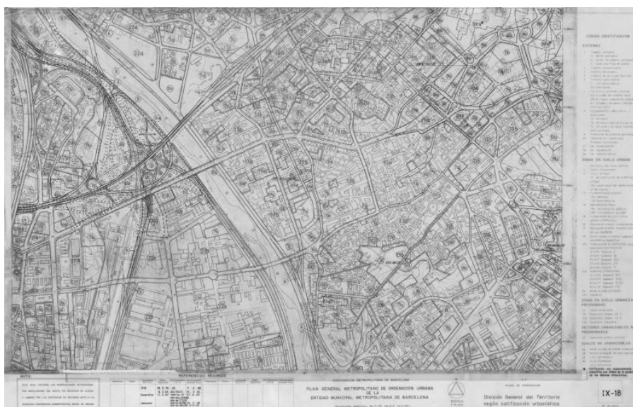
Ilustración 2. Extracto del plano IX-18 del Plan General Metropolitano, relativo a la División General de Territorio según calificación urbanística en la zona del Estudio.