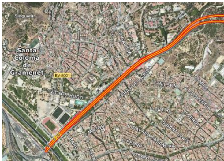
Ilustración 1. Ubicación general del ámbito del estudio.

del segundo cinturón y entorno, que define la traza de la futura B-20 a su paso por la ciudad, aprobado el 11 de diciembre de 1986.