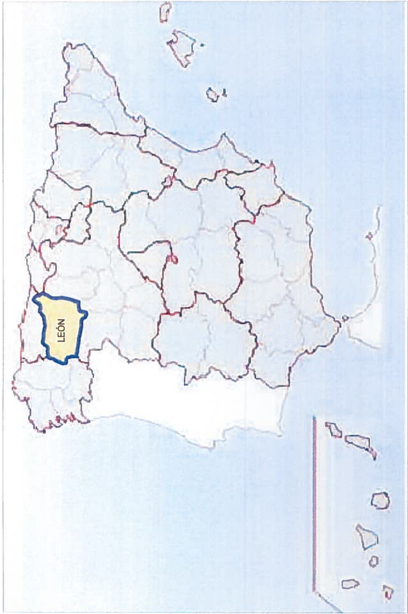
SITUACIÓN GEOGRÁFICA. SIN ESCALA