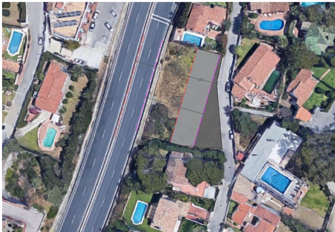
Propuesta de delimitación LLE a 23 m del eje de la carretera. Línea roja discontinua

FIRMADO por : CARAZO RIVERA, ESTHER. A fecha: 18/05/2022. 12:19 PM Total folios: 4 (4 de 4) - Código Seguro de Verificación: MFOM02597AF4D0302A0D5CB98Z05 Verificable en https://sede.mitma.gob.es