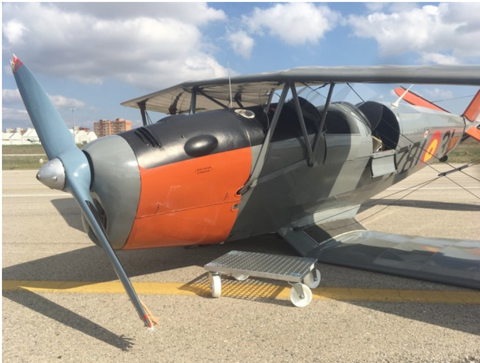
Figura 1. Aeronave tras el accidente