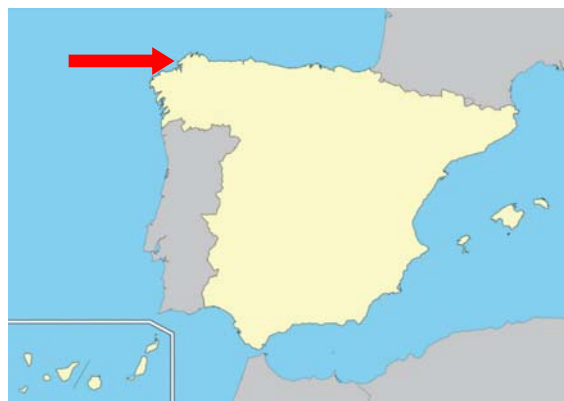
Figura 2. Zona del accidente