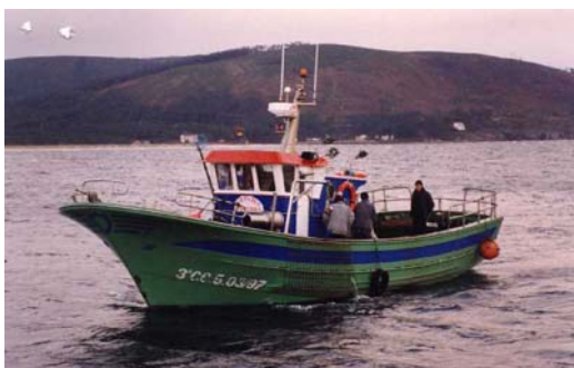
Figura 1. Embarcación de pesca SEGUNDO HERMANOS PAPIN