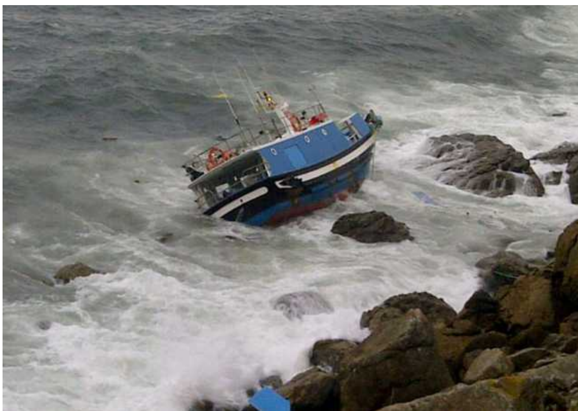
Figura 4. Pesquero embarrancado

Al lugar del accidente llegó la E/S SALVAMAR REGULUS. Dadas las malas condiciones marítimas y que la E/P SEGUNDO HERMANOS PAPIN presentaba daños severos en el casco, se descartó su remolque.