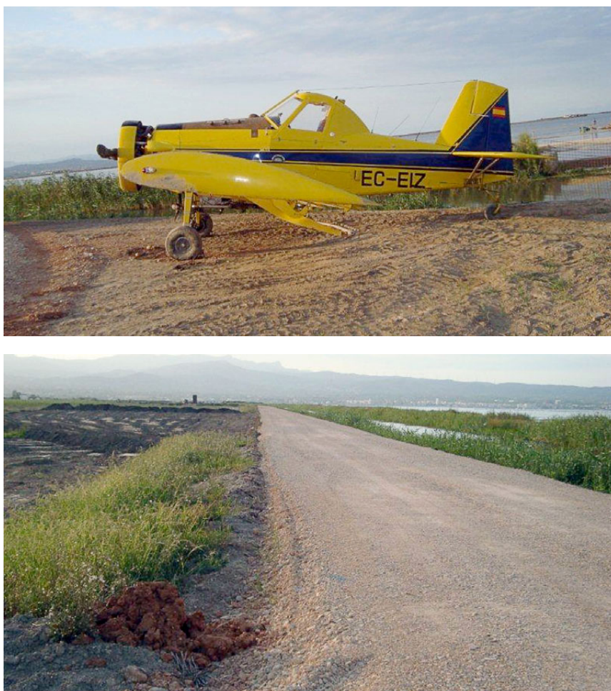
Figura 1. Estado de la aeronave EC-EIZ tras el incidente y camino donde aterrizó

En el séptimo vuelo del día la aeronave despegó a las 08:45 h y durante el vuelo notó que el movimiento del mando de gases no se transmitía al motor y que éste perdía potencia, por lo que tuvo que realizar un aterrizaje de emergencia fuera de campo. El aterrizaje se produjo a las 08:58 h, 13 minutos después del despegue. La aeronave aterrizó sin problemas en un camino de tierra de aproximadamente 4 m de ancho, aunque en la última fase de la carrera de aterrizaje se desvió y cayó a una acequia colindante.