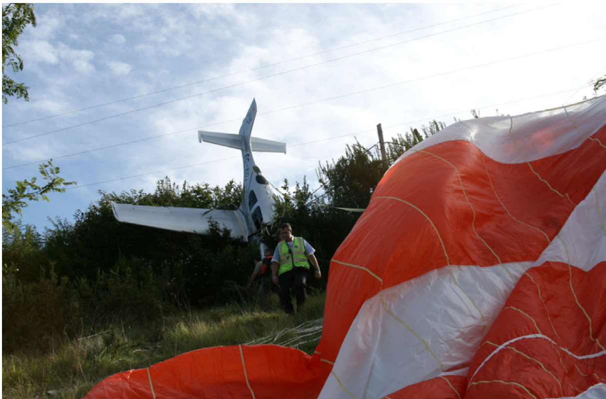
Figura 2. Situación final de la aeronave

Dado que había salido de la primera barrena a 2.500 ft, y posteriormente había realizado un giro completo, calculó que debería de estar a menos de 2.000 ft sobre el terreno. Considerando su nula experiencia en practicar salidas de barrenas y la poca altura disponible, decidió entonces disparar el paracaídas de emergencia. Aunque no tenía la certeza de que el paracaídas estuviese correctamente desplegado, sí que sintió como la caída se producía más suave y ordenada. El avión cayó sobre una zona arbolada y sintieron como se rompían los cristales a la vez que la cola del avión se iba a la derecha hasta que quedó apoyada en un tendido telefónico.