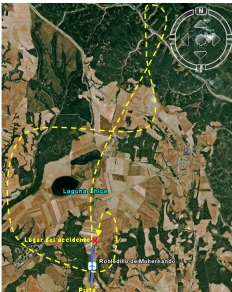
Figura 1. Trayectoria de la aeronave

Una vez que arrancó el motor estuvo esperando 10 minutos, y después despegó por la pista 01. Voló con rumbo noreste hasta llegar a unas 5 NM, y ascendió a 4.000 ft de altitud.