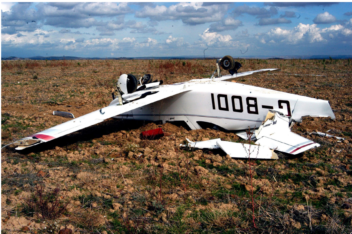
Figura 2. Posición final del avión

Las palas de la hélice se partieron al impactar, pero no se astillaron, y sus restos quedaron a poca distancia del avión.