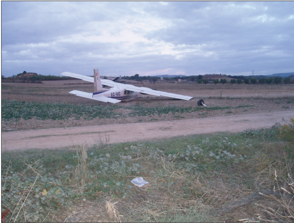
Foto 1. Vista general de la aeronave