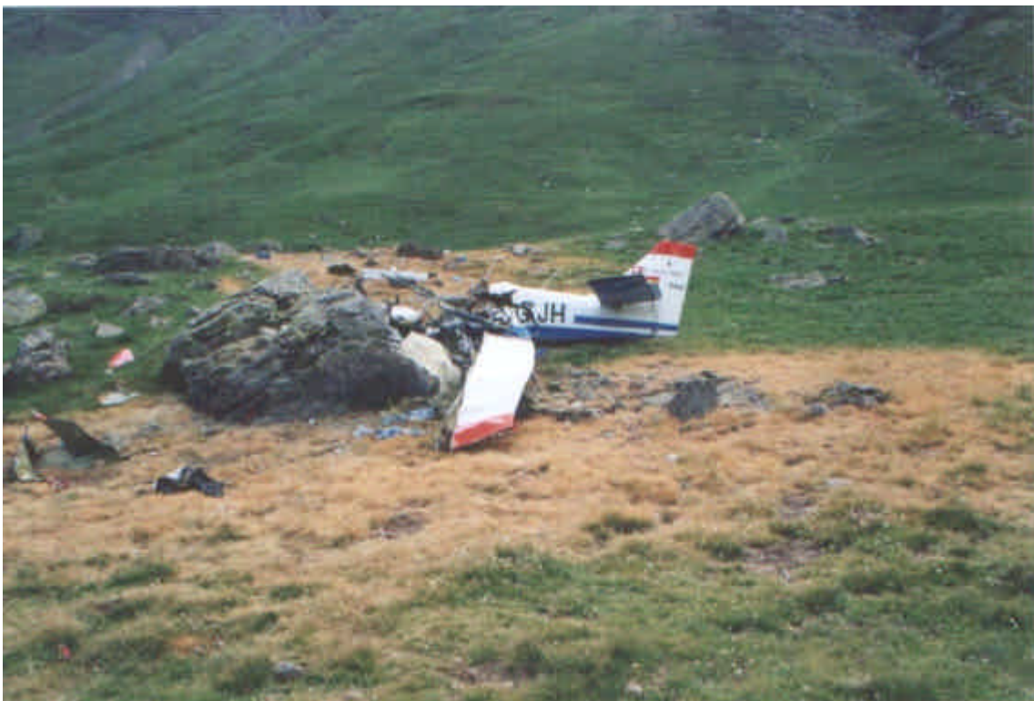
Vista lateral izquierda