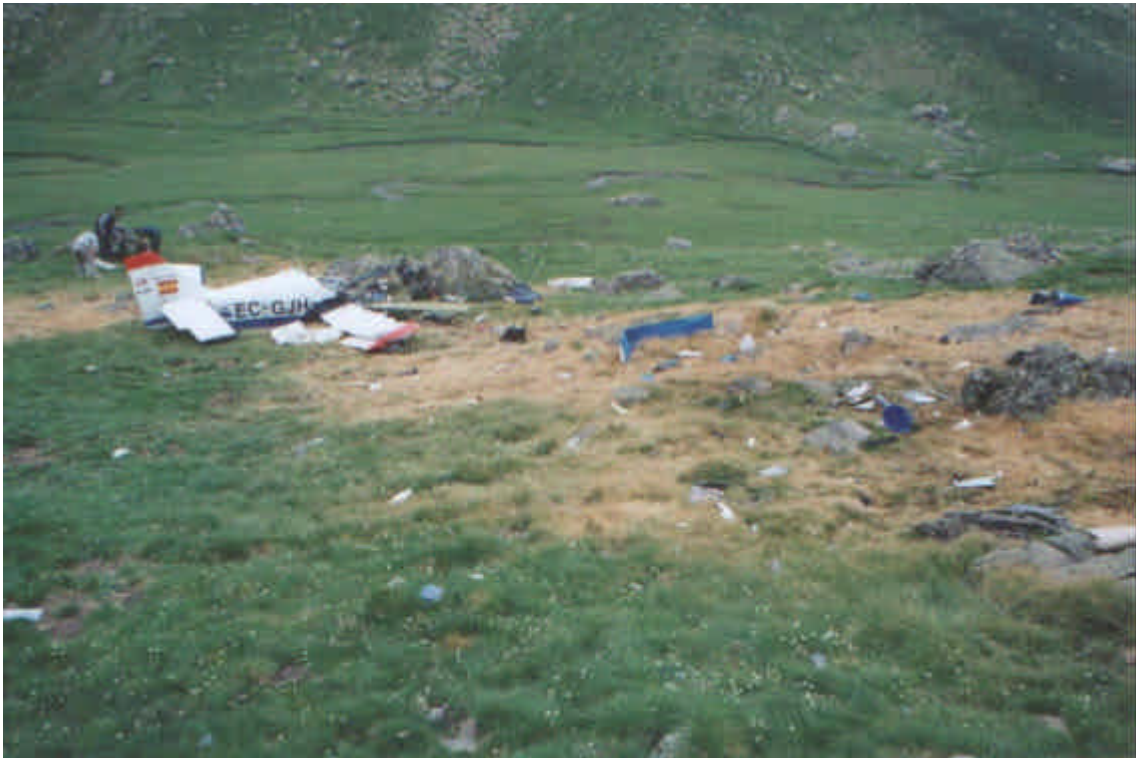
Vista lateral derecha