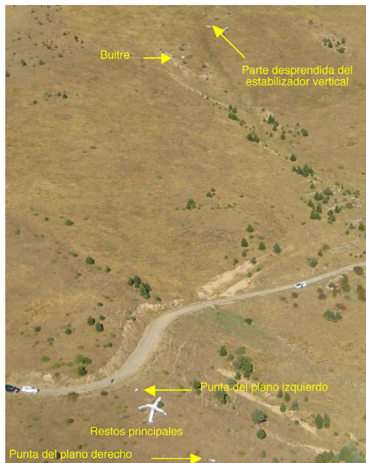
Figura 1. Restos en el lugar del accidente

De acuerdo con las declaraciones de otro piloto que se hallaba volando a una distancia aproximada de 3 km al oeste, el avión inició una caída girando en sentido horario y se precipitó contra una ladera de elevada pendiente.