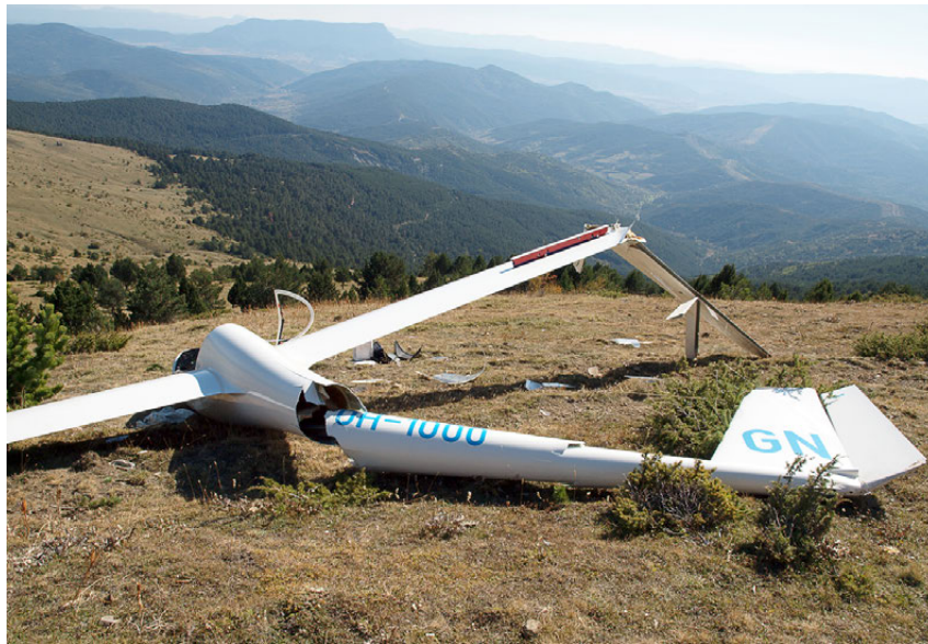
Figura 4. Fotografía del conjunto de cola

El estabilizador vertical tenía una rotura en su parte derecha que se correspondía con la rotura que presentaba la parte del estabilizador vertical que se había desprendido. El timón de dirección no tenía daños.