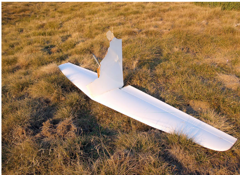
Figura 3. Fotografía del conjunto de cola desprendido

La aeronave cayó ladera abajo, a 1.910 m de altitud a una distancia de 340 m de la parte del conjunto de cola que se había desprendido. El fuselaje quedó orientado hacia el sur y estaba partido aproximadamente a un tercio de su longitud desde la cola (véase figura 4).